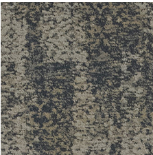
Classic 85496 LRV 17.6