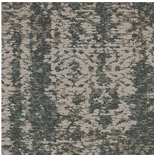
Novelty 85327 LRV 21