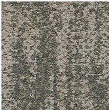
Recollect 85215 LRV 23.9