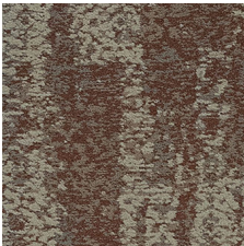
Nostalgic 85665 LRV 13