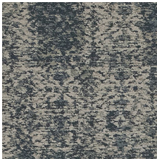
Timeless 85402 LRV 17.4